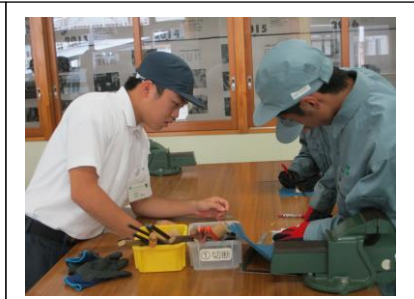
R5 授業交流「作業学習」