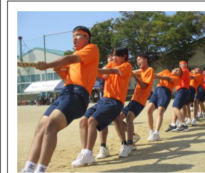
R5 行事交流「体育大会」