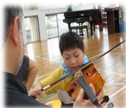
「よく見て集中しています」