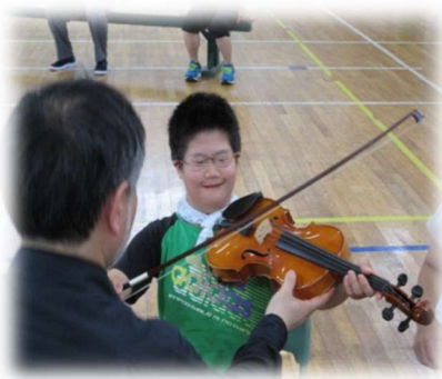
「やったあ！弾けたよ」