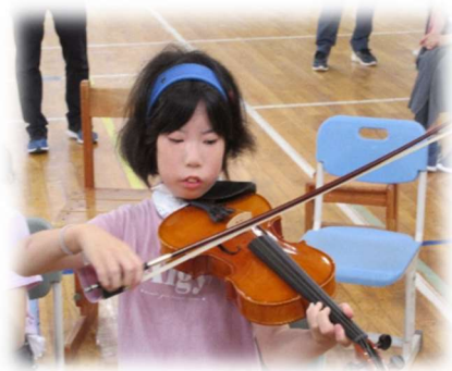
「一人で弾けました！」