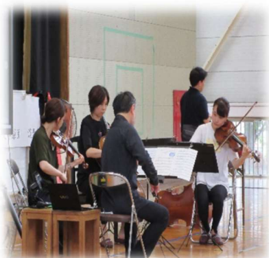
「新日本フィル・管弦四重奏」

演奏会の中で、楽器体験をしました。今回で新日本フィルの演奏会も3年目になります。楽器体験や演奏を聴く姿勢も落ち着いていました。