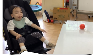
倒れたよ！にっこり