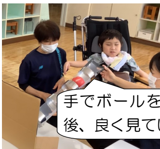
手でボールを押しした後、良く見えています