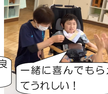
一緒に喜んでもらえてうれしい！