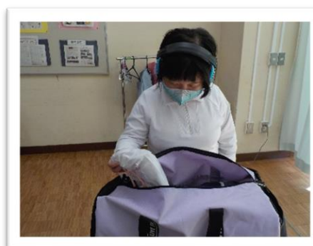
荷物を確認しました！