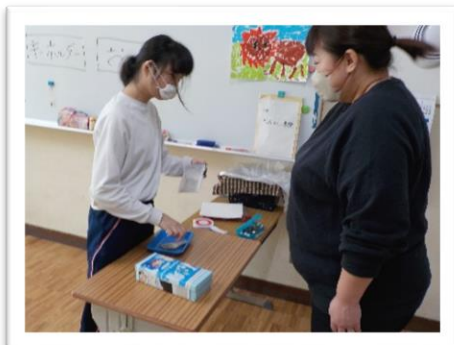
お土産を選び買いました！

9月29日から修学旅行に向けての学習が始まりました。過去の学習を映像で振り返り、「修学旅行ってなに？」をテーマに少しずつ修学旅行のことを知りました。家を出る所からしおりを作り、画像を見ながら楽しみなことを選び、巨大カレンダーを埋めていきました。タブレットやPCを活用して見学先の情報を集めたり、動画や写真で公共交通機関を利用する時のマナーや、様々な改札を知ったりしました。家族へのお土産を選び買う学習では、子ども達が家族のことを考えながら練習している様子が伺えました。また宿泊に必要な荷物を教師と一緒に確認し、宿泊を体験する意識が深まりました。このように見通しをもって学習してきた6年生は期待を胸に抱き当日を迎えることができました。