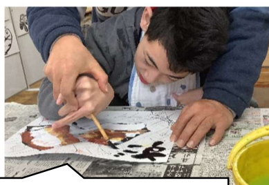
すご〜いあつ〜いもち