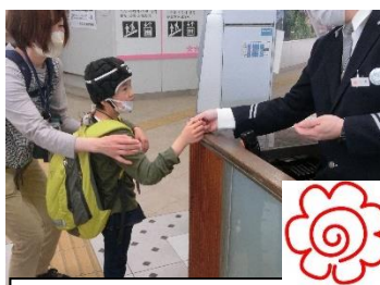
切符を渡して改札通過