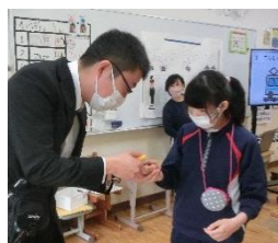
切符の渡し方の練習