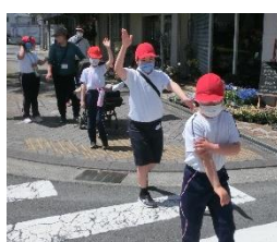
駅までの道のり確認