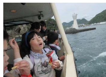
『かっぱえびせん、えい!』

6月13日には「下田ロープウェイ」へ行ってきました。暑い日でしたが、学校から乗り場まで往復歩きました。ロープウェイに乗って、寝姿山頂から見える下田湾や島々はとてもきれいでした。山頂からのウォークラリーもやり、友達や教師と一緒に歩くのががんばりました。