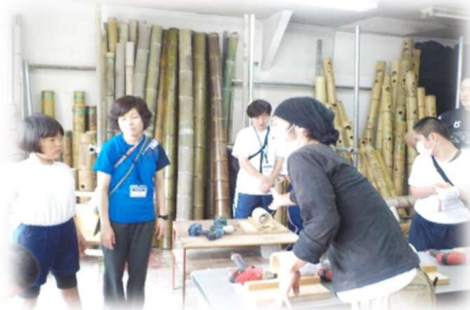
『工房で作り方の説明』

6月23日に中学部で「夕涼み会」を行いました。竹灯籠作りをするようになって3年目になりますが、今回も「竹楽しみまくる会」の方や商工会議所の方にお世話になりました。工房へお邪魔して竹灯籠作りを教えてくださいました。はじめは、工具（ドリル）の扱いにおっかなびっくりでしたが、工房の方や教師と一緒にやることで、コツを掴み楽しんでできたようです。提灯作りやお楽しみもたくさんあり、夕涼み会へ向けて中学部全員で協力して取り組めた会になりました。