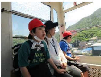
『ロープウェイに乗って』