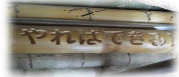
『学部目標 やればできる』