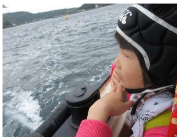
『海風が気持ちいい!』