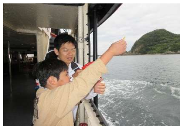
『カモメさん、どうぞ!』

5月25日は下田港内巡りができる「サスケハナ号」に乗船してきました。船が走り始めるとカモメやトンビが観光客のあげる「かっぱえびせん」目当てに集まってきました。自分たちもつまみながら、カモメやトンビへのエサやりを楽しみました。