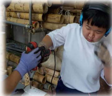
『こわいけど楽しかった』