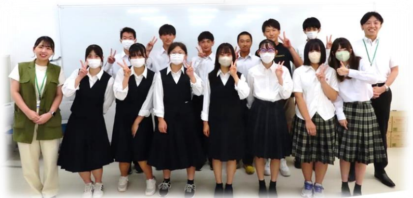
今回の講座を担当して下さった先生と、生徒の皆さん