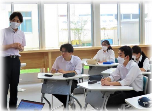
いいプレゼンとは…真剣に考えます。