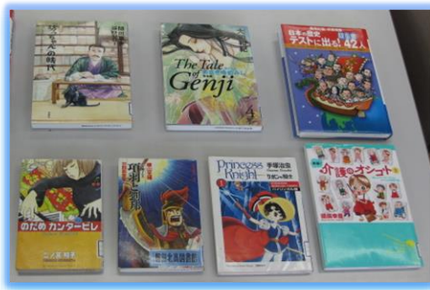
☆漫画で国語（森鷗外や源氏物語、漢文） 歴史の勉強もできる！？