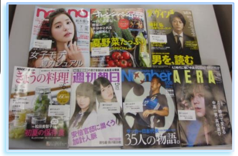
☆雑誌は借りることもできます！