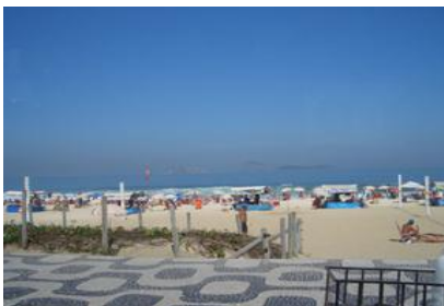
リオデジャネイロ コパカバーナ海岸