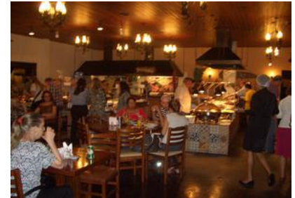
昼食会場 店内は多くの客で賑う