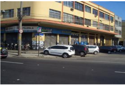
リオデジャネイロ市内 落書きが目立つ