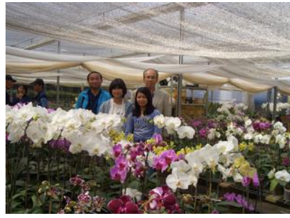
胡蝶蘭の咲き乱れる中で