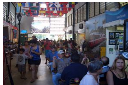
コルコバードの丘は大混雑で断念