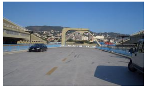
リオのカーニバル会場