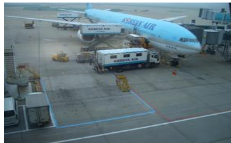
インチョン国際空港 帰国する航空機(大韓航空)