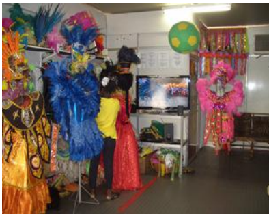
リオのカーニバル会場の店 カーニバル体験ができる