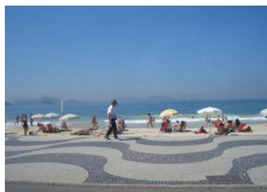
リオデジャネイロ イパネマ海岸