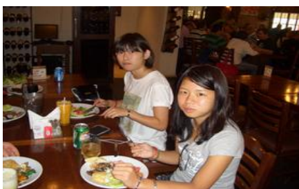
リオデジャネイロ市内 昼食 ブラジル郷土料理