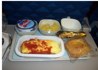
ロサンゼルス国際空港搭乗ゲート 機内食 オムレツセット