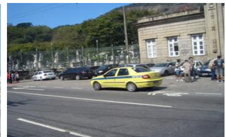
リオデジャネイロ市内 前方、市内墓地（墓誌）