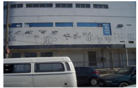
リオデジャネイロ市内 落書き