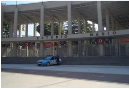
2016リオ五輪会場入口