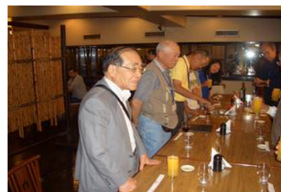
お別れ夕食会 OB代表挨拶