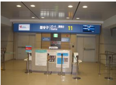
インチョン国際空港搭乗口 中部国際空港に向けて

8月25日(月) 晴 復路 ~インチョン国際空港~中部国際空港~浜松駅バスターミナル ~浜松駅