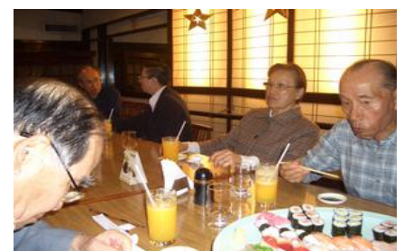
お別れ夕食会 県人会との歓談