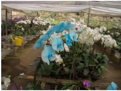
青色色素を吸わせた胡蝶蘭