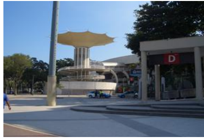
2016リオ五輪会場外観