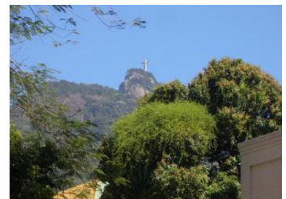
リオデジャネイロ コルコバードの丘を望む