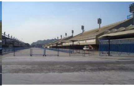
リオのカーニバル会場