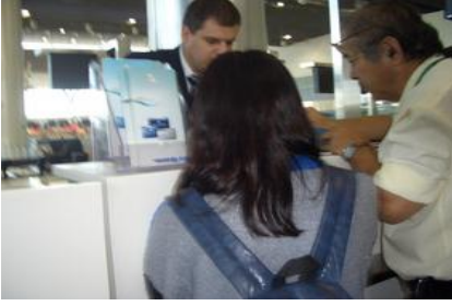
ギャラリーヨス国際空港 帰国に向けて搭乗手続き