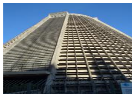
リオデジャネイロ市内教会 斬新な建造物