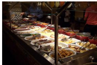
昼食会場の料理 多くの料理が並ぶ