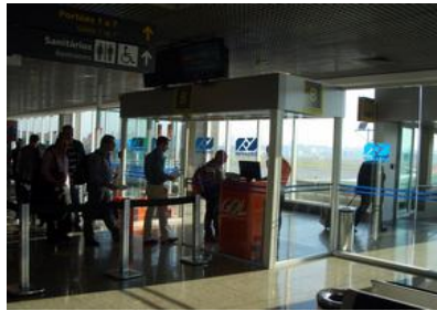
コンゴニャス空港（サンパウロ） リオデジャネイロ リオデジャネイロへ