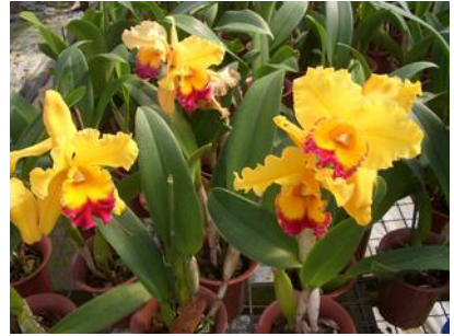
日系芳賀農場 デンドロのバルブ伏せ 日系芳賀農場 (ラン温室) 日系芳賀農場 見事なカトレア