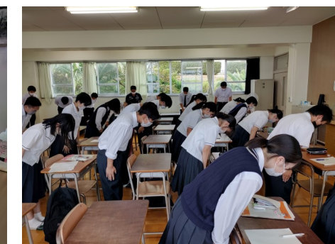
▲就職試験激励会には、21名の生徒が参加した