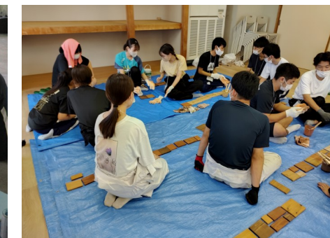
▲芝浦工業大学とのワークショップ