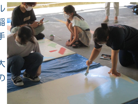
▲静岡大学学生の壁画制作を手伝う

ワークショップを実施しました。芝浦工業の大学生の活動についての説明を受けたり、木工小物制作体験等を行いました。