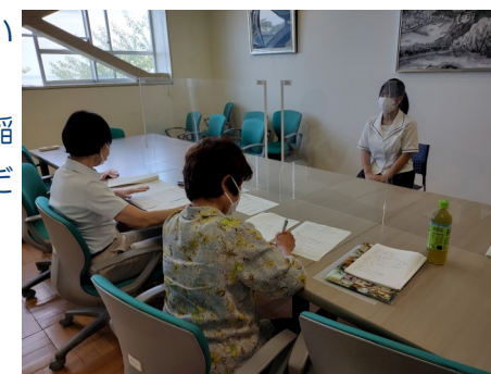
▲学校評議員・PTAの方の協力による面接指導

9月15日(木)には、就職試験激励会を行いました。副校長・学年主任より激励の言葉をいただき、進路課長より就職試験当日の注意事項等の説明を受けました。