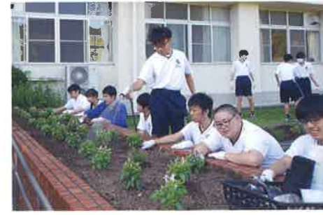
Volunteer Club ボランティア部