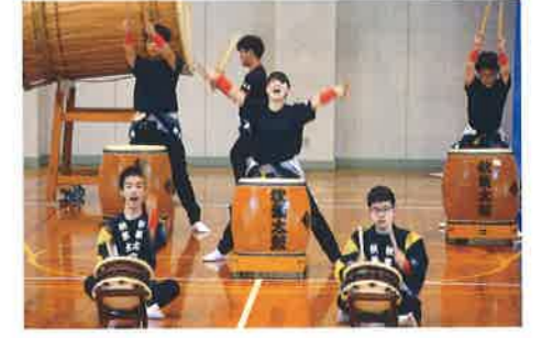
Japanese Drum Club 郷土芸能部