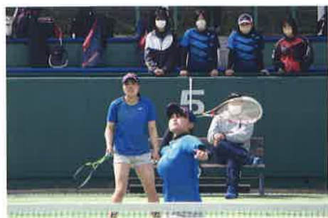
Soft-Tennis Club ソフトテニス部