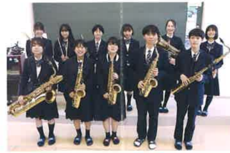
Brass Band Club 吹奏楽部