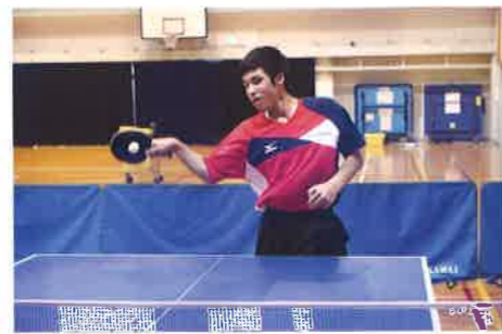
Table-Tennis Club 卓球部