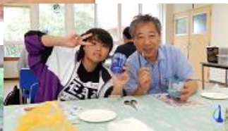
← ↑ 琉球グラス作り