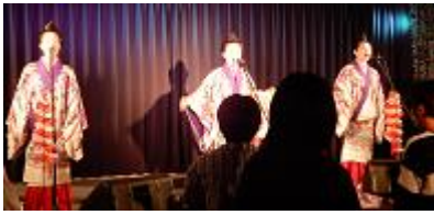
↑ ライブハウス島唄「ネーネーズ」 (「ネーネー」=「お姉さん」)