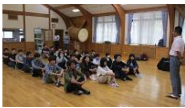
↑ 出発式、副校長先生あいさつ