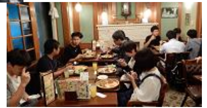
↑ ビュッフェカラカラにて夕食