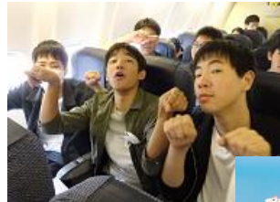
← 機内にて、すでにシーサー？