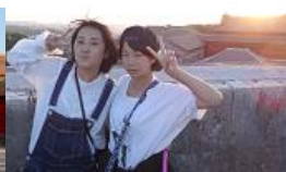
← ↑ 首里城