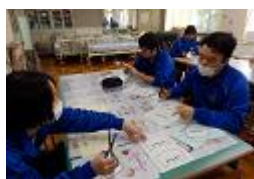
↑ ボランティア部の活動の様子