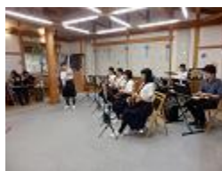
↑ 吹奏楽部「たぬきの森コンサート」の様子