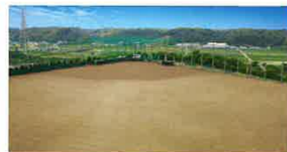
グラウンド・トラック