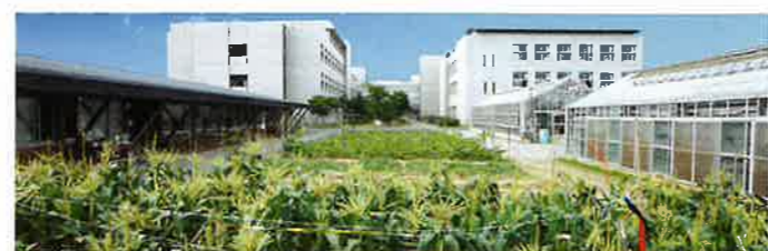
農業実習棟(左)と4つの温室(右)が、水田や農場を囲むように配置。

「実践的実習のための充実した施設」農業を学ぶための圃場や施設をはじめ、5室のパソコン室・福祉実習室・CAD製図室など、30室を超える実習室を持つ。最新の機材を揃え「必要とされる人材の育成」に取り組んでいます。