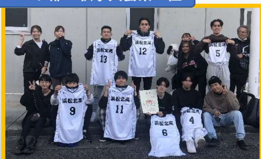
バスケ部 : 秋季大会県3位