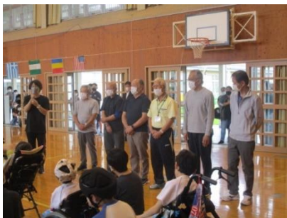
けやきの会の方々に競技中のサポートをしていただきました。