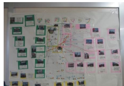
地域マップが完成しました。