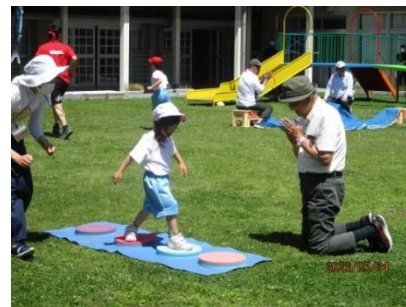
自分の得意な種目を選んでゴールを目指しました。