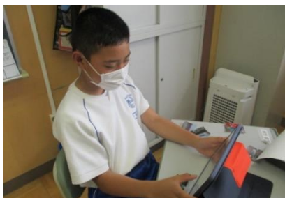
なぜ？どうして？気になったことを検索しています。

5月の総合的な学習の時間に、学校近隣の地域マップ作りの学習に取り組みました。近隣の施設や公園などに出掛け、写真を撮ったり iPad を使って気になるところを調べたりしました。友達と協力して、自分たちの地域マップを作ることができました。