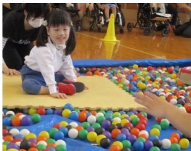
ボールプールスライダー 揺れや回転を楽しみながら頑張りました。

5月の後半に運動会を行いました。コロナ禍の影響もあり、なんと運動会開催は4年ぶりとなりました。1年生にとっては初めての運動会でドキドキワクワク！学習の成果を発揮して頑張りました。今回の運動会は、けやきの会の方々にボランティアとしてサポートいただきました。ありがとうございました。