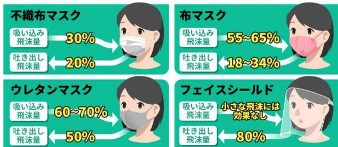
スーパーコンピュータ「富岳」によるシミュレーション結果。豊橋技術科学大学による実験値を元にハフポスト日本版が作成

マスクは、感染症対策でも重要な役割を果たしています。その中でも、特に不織布マスクはかなり効果が高いとされています。使い捨てなので、清潔に使うことができます。できるだけ不織布マスクを使用しましょう。