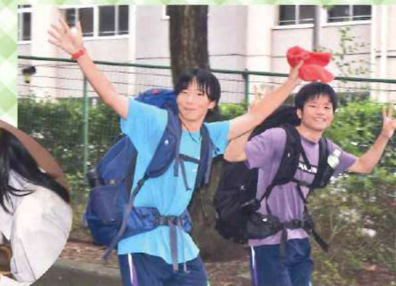
● ワンダーフォーゲル部