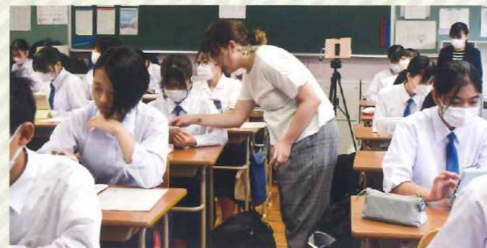
● ALT との TT