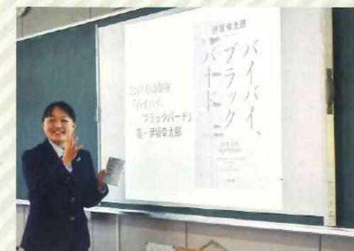
● クラスチャンプ本決定戦