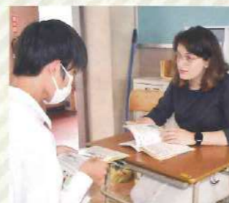
● ALT の個人指導