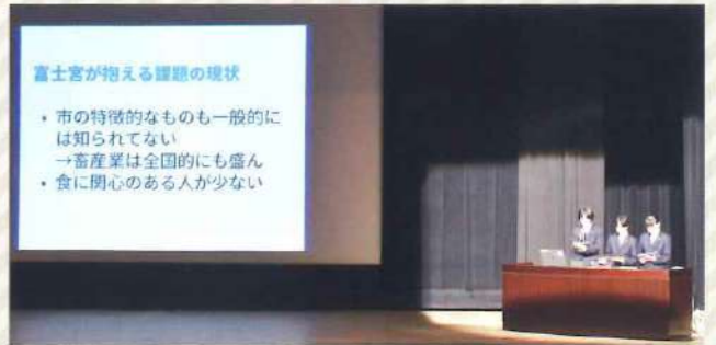
● 探究成果をプレゼンする