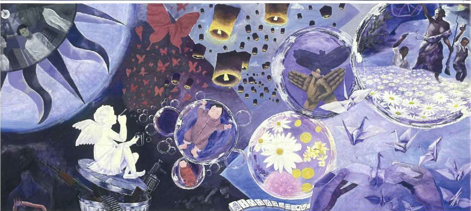
キッズゲルニカ富士宮プロジェクト参加作品 富士宮西高美術部「兵士たちの夢」