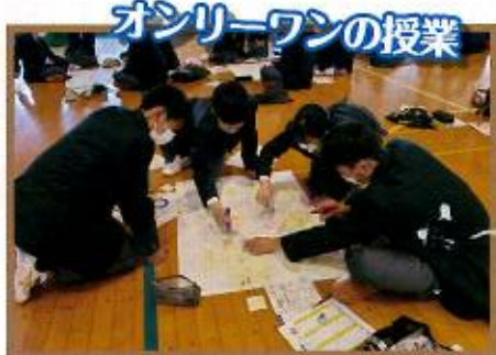
オンリーワンの授業 グループワーク入門講座(1年)