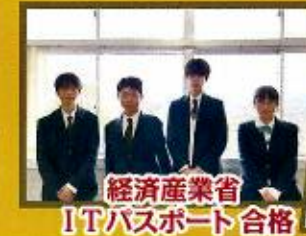
経済産業省 IITパスポート合格