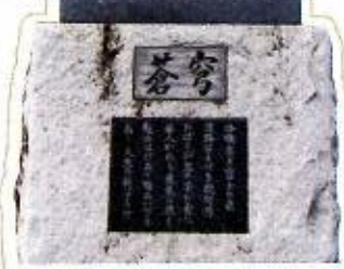
蒼穹とは「真っ青な空」を意味しており、北高生の精神を象徴しています。