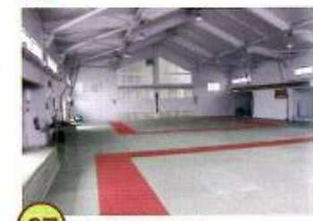
07 北辰館 柔道場