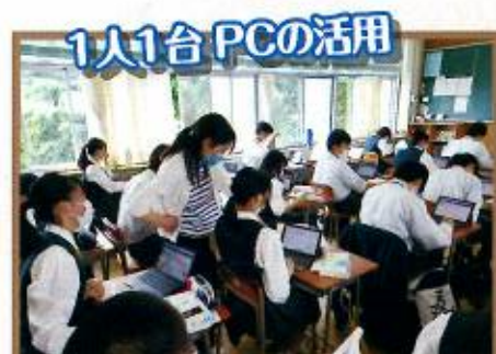
1人1台PCの活用 現代の国語の授業(1年)