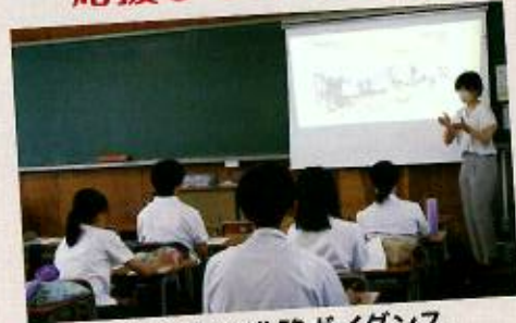
少人数の進路ガイダンス