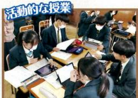
活動的な授業 総合的な探究の時間(2年)