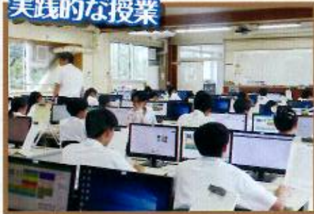
総合実践の授業(3年)