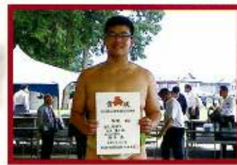
【東海】相撲部（団体）（個人）