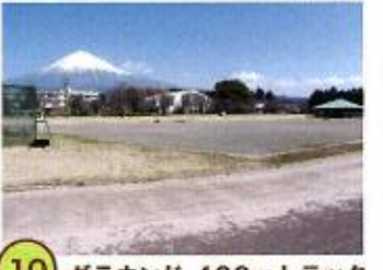
10 グラウンド 400mトラック