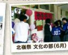
北嶺祭 文化の部（6月）