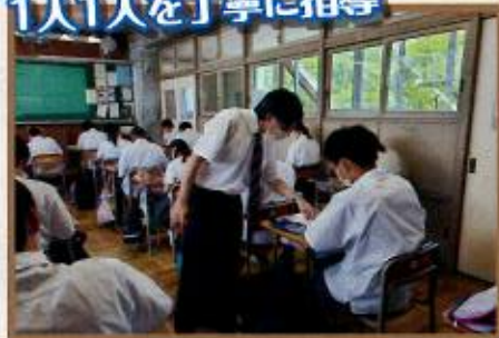
原価計算の授業(2年)