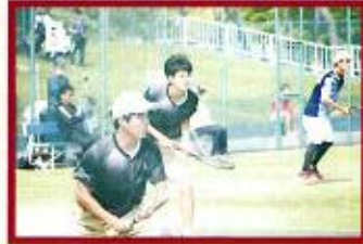
【全国】【東海】男子ソフトテニス部（ダブルス・シングルス）