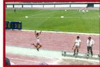
【東海】陸上部 男子三段跳