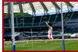
【東海】陸上部 男子棒高跳