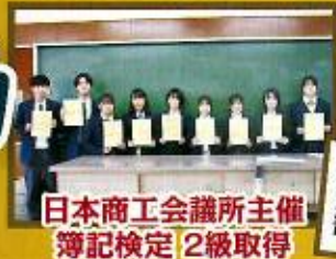
日本商工会議所主催 簿記検定2級取得