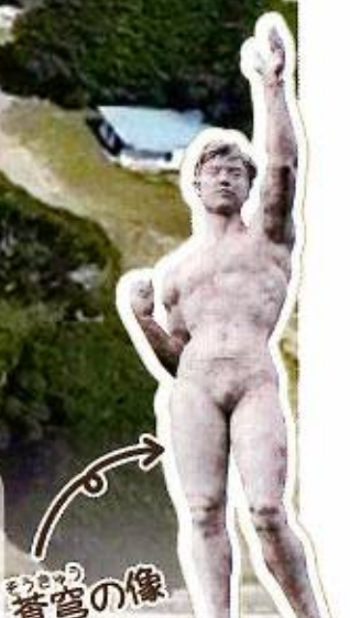
そうじまの像 (玄関前)