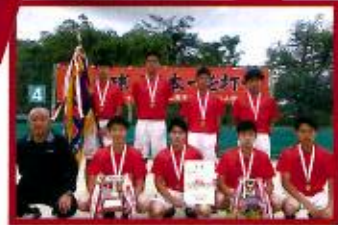
【全国】【東海】男子ソフトテニス部（団体）