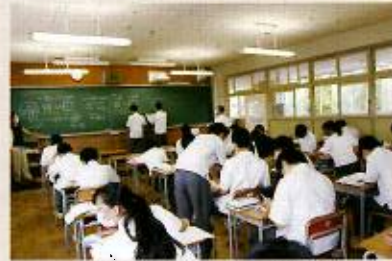
進路に合わせた補講