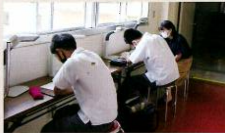
きめ細かな個別指導