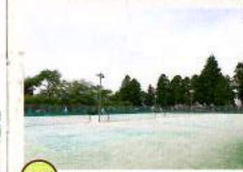
03 テニスコート 6面