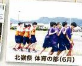
北嶺祭 体育の部（6月）