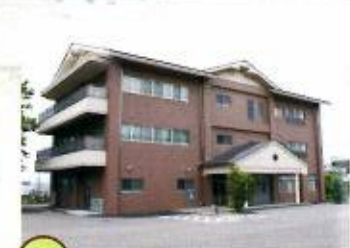
02 北嶺館 宿泊研修施設