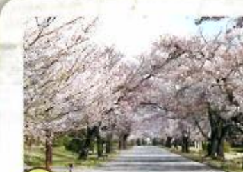
01 中央道 330m