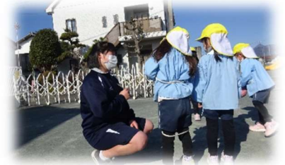
（富士宮北幼稚園での交流の様子）

総合的な探究の時間を中心に、地域の老人ホームや幼稚園、福祉施設との交流活動を実施する。