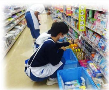
(ウエルシアで商品の 品出しをしている様子)