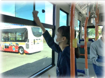
(富士急静岡バスで 車内を清掃している様子)