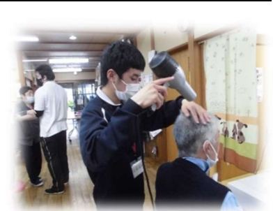
(かやの里でドライヤーを使って 髪を乾かしている様子)