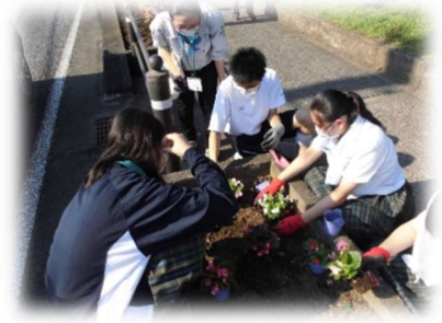
（北高と合同で花壇の花植えをしている様子）