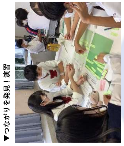
▶ つながりを発見！演習

ジェンダー エネルギー テクノロジ 医療・福祉 水・環境・生物 教育 経済成長や格差 災害・都市や農村 消費・食・栄養 戦争と平和