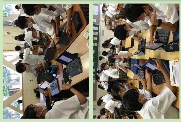
▶ 論文抄読会資料の例 身近な高校生活（ここでは学習）の関心事を題材にした論文をレポート