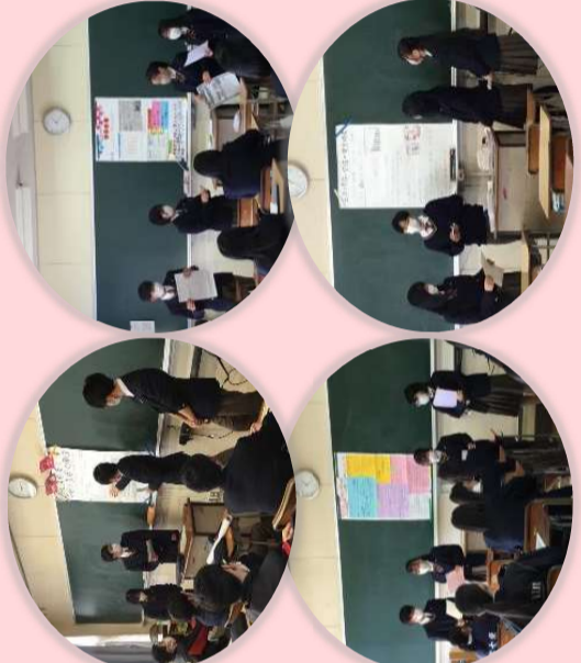
▲ 2月16日(木) 成果発表会