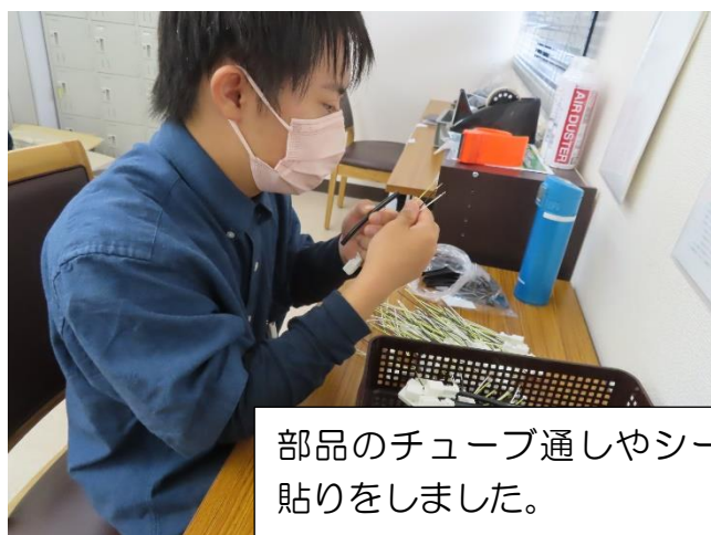
部品のチューブ通しやシール 貼りをしました。