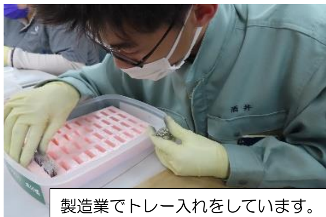
製造業でトレー入れをしています。 集中力が必要な仕事です。