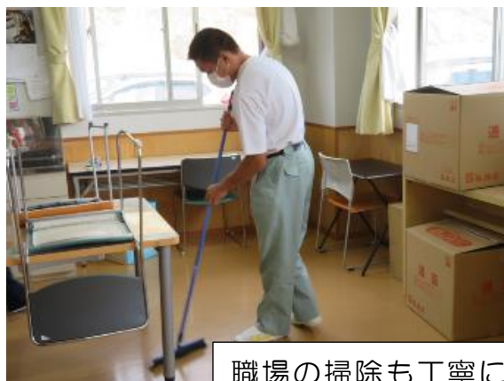
職場の掃除も丁寧に行う ことができました。