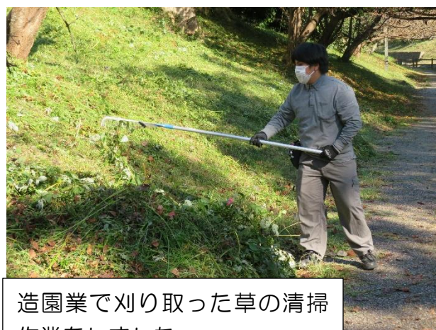
造園業で刈り取った草の清掃 作業をしました。

2年生は自分の課題と向き合い目標を立て、校内集中作業・職場実習に臨みました。 今回いただいた評価を受け止め、良い所は自信にし、課題点は学校生活や作業学習等で改善し 3年生に繋げていけると良いですね。実習先へのご挨拶等、ご家庭の協力、ありがとうございました。