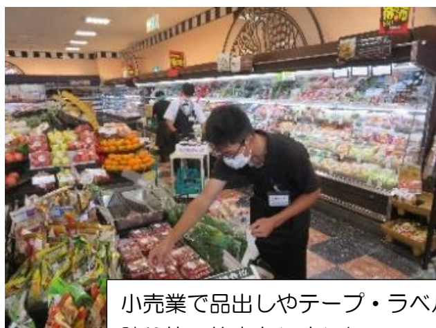
小売業で品出しやテープ・ラベル 貼り等の仕事をしました。