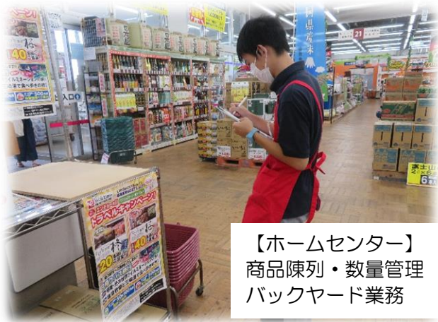
【ホームセンター】 商品陳列・数量管理 バックヤード業務