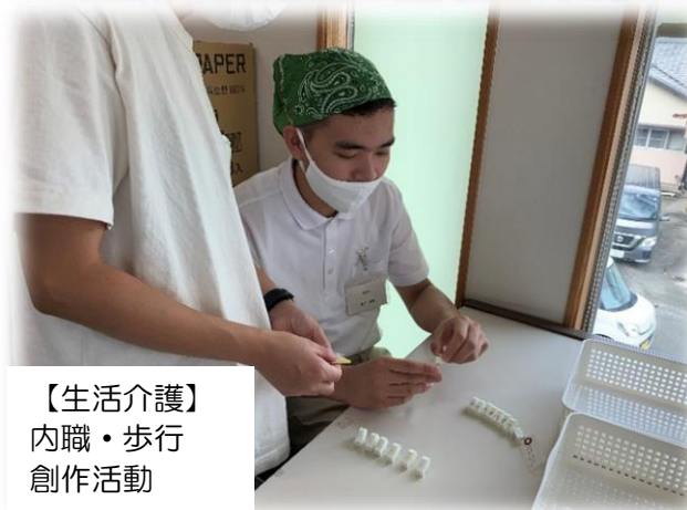
【生活介護】 内職・歩行 創作活動