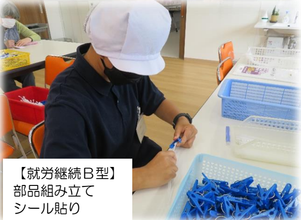
【就労継続 B型】 部品組み立て シール貼り