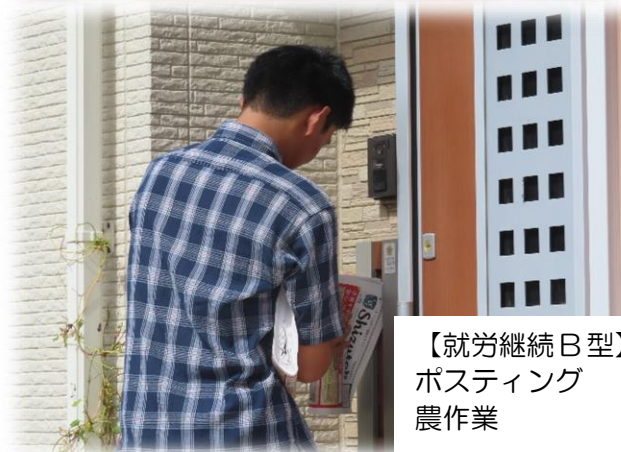
【就労継続 B型】 ポスティング 農作業