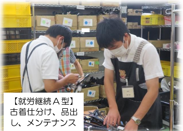
【就労継続 A型】 古着仕分け、品出 し、メンテナンス