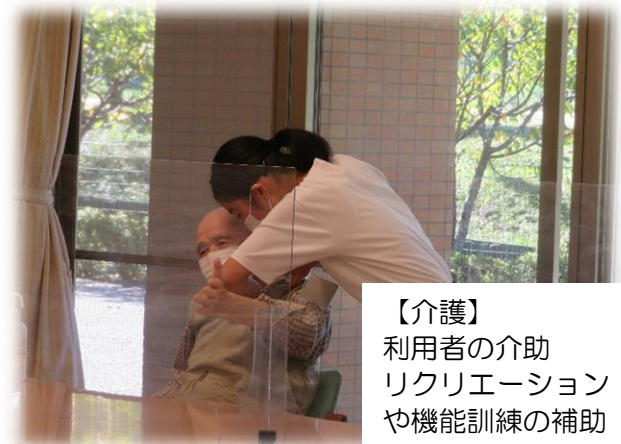
【介護】 利用者の介助 リクリエーション や機能訓練の補助