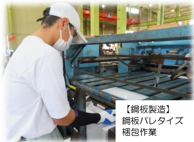
【鋼板製造】 鋼板パレタイズ 梱包作業

【福祉 30名】・就労継続支援 A型(7)・就労継続支援 B型(17)・生活介護(6)