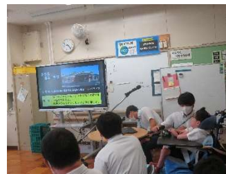
生活介護事業所、校内実習：リサイクル室