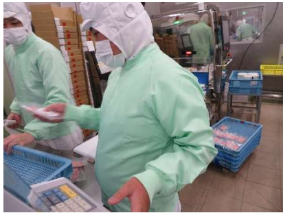
【製造業】 ラベル貼り 箱詰め