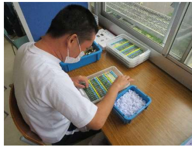
【福祉事業所】 ハンガーの組立 先端並べ 座金通し

落ち着いて作業に取り組むことができました。職場の人と自分なりのコミュニケーションをとることができました。