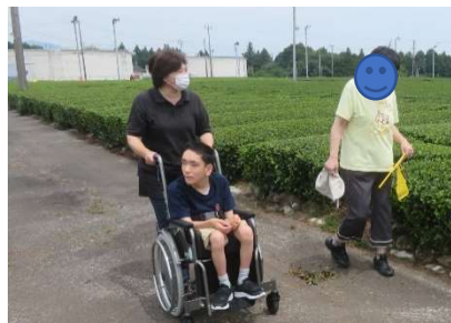
【福祉事業所】 散歩、音楽活動 スヌーズレン リフレクソロジー

初めての環境でも普段通りに、落ち着いて、あいさつや支援への協力動作など自分から行うことができました。