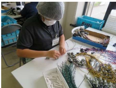
【福祉事業所】 プレート入れ、コ ードの組立、プラ モデル・ねじの封 入、シーラー作業

落ち着いて作業に取り組むことができました。職場の人と自分なりのコミュニケーションをとることができました。