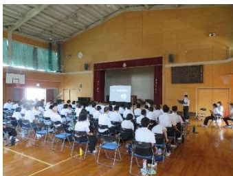
企業、A型事業所、B型事業所、校内実習：体育館