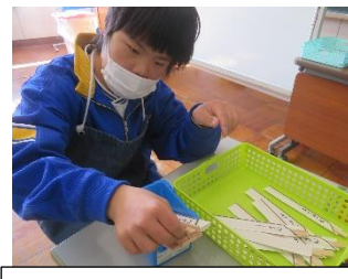
わりばしの組み立て