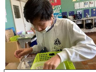
ラミネートはがし

見学後の振り返りの授業では、生徒から「ごみをまた使えるようにするのがすごく大変そうだけど、働いている人は疲れていても休まずに働いていてすごいと思いました。」「細かい作業をやっていて大変だと思いました。」などの感想がありました。実際に働いている人の姿を見て、働く人の姿勢について知ることができたと思います。