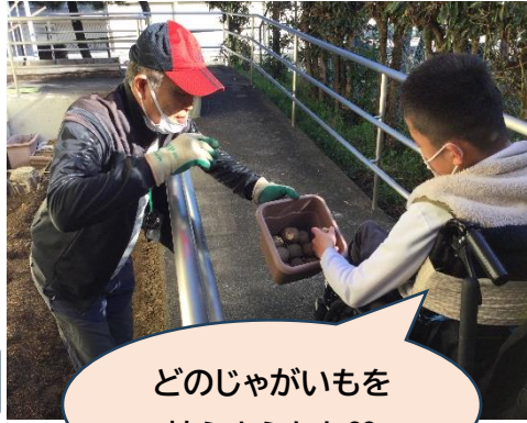
どのじゃがいもを 植えようかな??