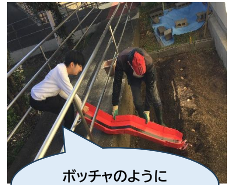
ポツチャのように 的(穴)を目がけて!!

自分たちで選んだじゃがいもを10個植えました。来年度の収穫に向けて、皆で育てていきたい と思います。ポテトフライで食べれると良いですね！