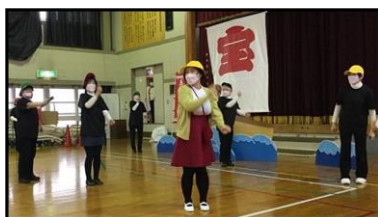
五反田楽友舞の皆さん

特に良かったポイントは、踊りを通して麻機地区の方々との出会い、一緒に踊ることでお互いに笑顔で元気に令和4年のスタートを切ることができたことです。