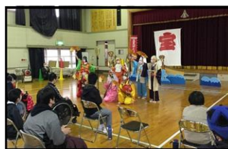
七福神の紹介・踊り