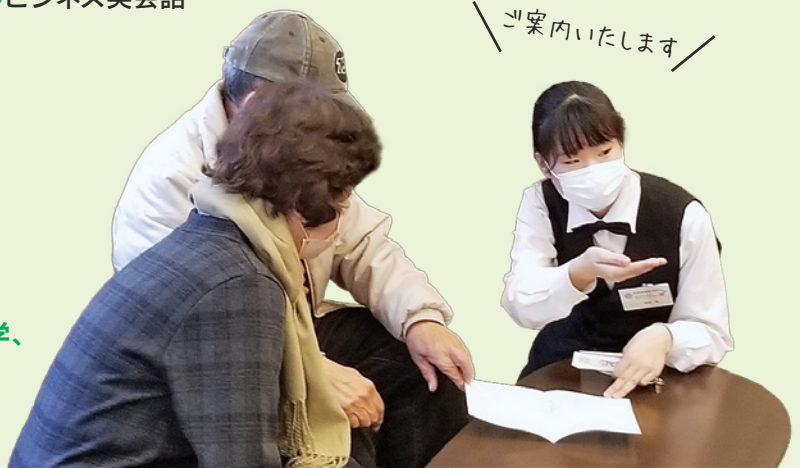
生徒が温泉旅館を運営する「高校生ホテル」のおもてなし