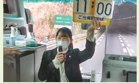
ツアーガイド実習