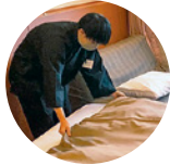
陸上記録会 3年生コース実習