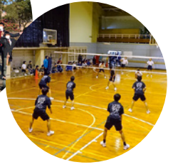
修学旅行 スポーツ大会