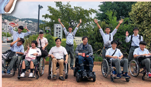
車いすユーザーを招いてバリアフリーの探究活動