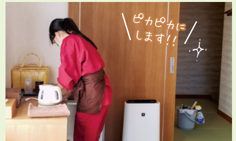
「高校生ホテル」客室の清掃