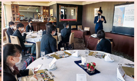
健康食メニューについて知識及び技術の習得