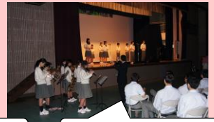
ボラ部と吹奏楽部