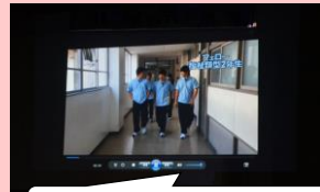
福祉コースはドラマを上映