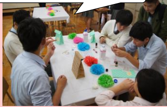
21HR アロマオイル作り