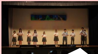
ボランティア部 手話歌