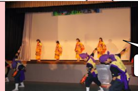
勇壮なエイサー部