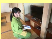
写真は過去のものです。